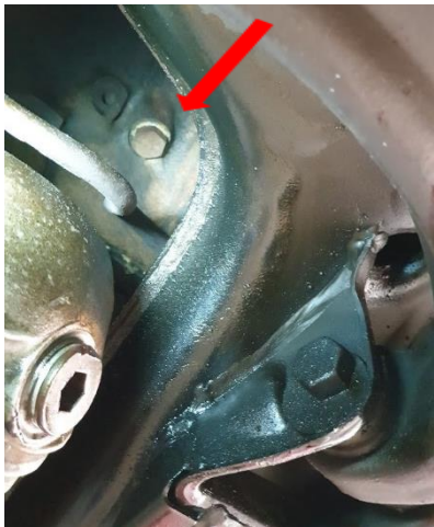
Links van motorblok