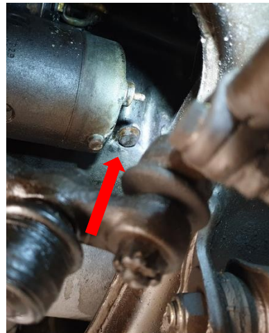
Rechts van het motorblok

Systeem via expansievat opvullen met koelvloeistof. Motor laten warmdraaien en voelen of de interieurverwarming warmte geeft. Motor even een paar keer op hoger toerental laten draaien om eventuele luchtbellen in het systeem er uit te krijgen. Als de bovenste slang van de radiator lekker warm begint te worden, het systeem op niveau brengen en afsluiten met het aanbrengen van de expansietankdop. Rest nog een proefritje en goed de motortemperatuur monitoren. Navullen!